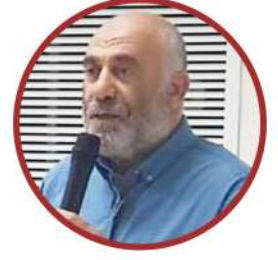
بقلم أ. يوسف كيال